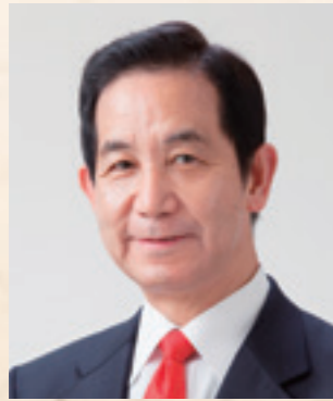
内閣府特命担当大臣 (地方創生、規制改革) 山本 幸三

「地方創生」とは「地方の平均所得を上げること」であり、その実現に向け、地域の皆様が「自助の精神」をもって、自主的・主体的に取り組む、持続的に稼ぐことが重要です。そのためには、地域の中堅・中小企業が、潜在的に有する「稼ぐ力」を発揮し、地域経済を盛り立てていくことが求められます。